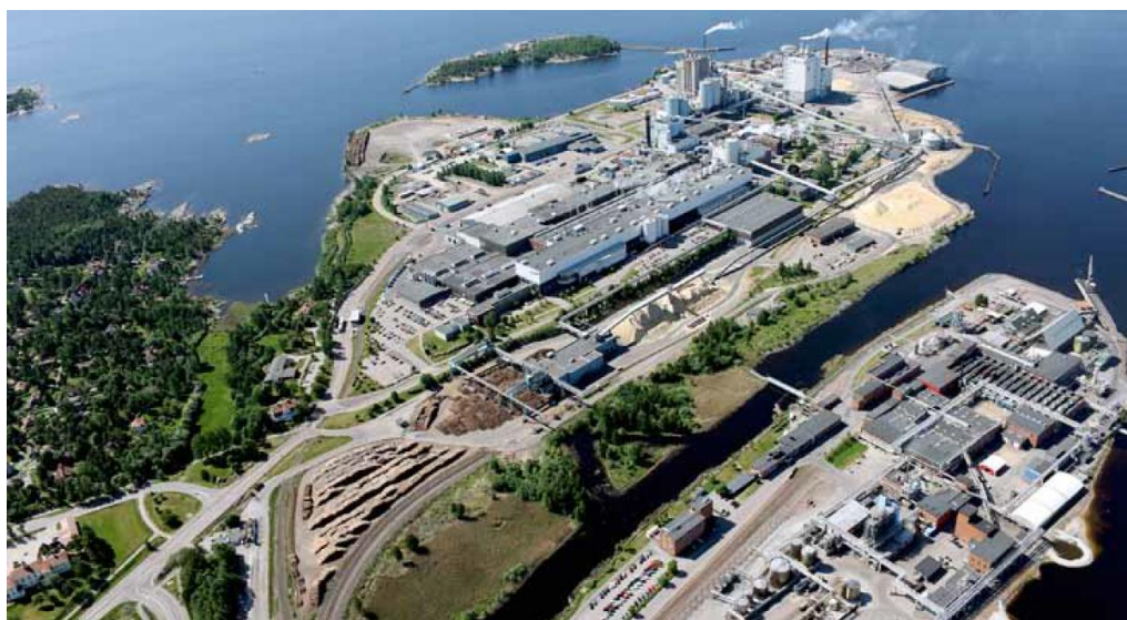
Bild 2. Översikt över Stora Enso Skoghalls bruk

I andra hand kommer räddningstjänsten att begränsa fortsatt skadeutbredning.